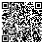
① 添付資料 自転車ルールブック

最後に、自転車は降りて押して歩かない限り、歩行者ではありません、れっきとした「車両」です。